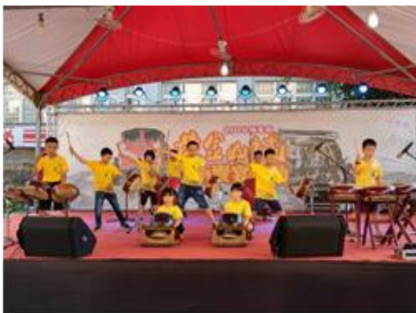
圖三 義方國小十鼓社

瑞芳區公所為了培育藝文種子的發芽與茁壯，提供學習機會，舉辦各項展演與藝術表演，促進民眾與藝文接觸的動機，在舉辦各式大型活動之餘，也能與外界交流藝術發展的狀況與樣態，與時俱增我們成長的能量。