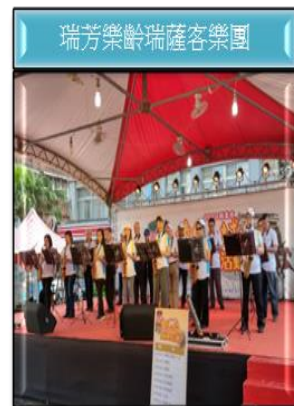
圖四 2019 黃金山城藝術饗宴表演節目