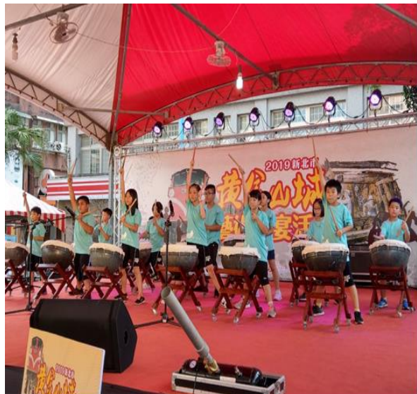
圖二 濂洞國小不一鼓

「2019 年黃金山城藝術饗宴」活動，結合瑞芳特色及文化資源透過音樂、舞蹈、藝術、人文四大面向，於黃金山城藝術饗宴共同呈現。活動內容以在地文化團體為主要表演，包括音樂劇團、薩克斯風、樂團表演、熱舞欣賞及礦工體驗等活動。藉這次活動提供大小朋友共同欣賞的契機，也激發在地社區、學校、藝文團體及文化工作者的參與，共同展現地方文化魅力，對自己居住的地方產生認同感及尊榮感，推展出瑞芳獨特之美及新風貌。